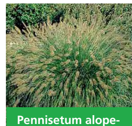
Pennisetum alopecuroides 'Hameln' Niedriges Lampenputzergras