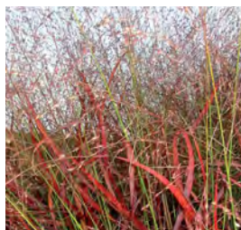
Panicum virgatum 'Rehbraun' Ruten-Hirse