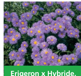
Erigeron x Hybride, blau Garten-Feinstrahl-aster

Blütenhöhe: 30-50 cm Blütezeit: Jul-Sep, R*