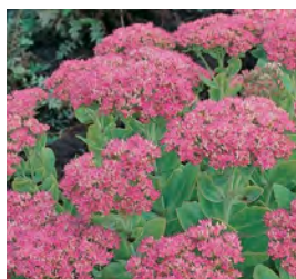
Sedum spectabile 'Rosenteller' Prächtiges Fettblatt

Blütenhöhe: 80-100 cm Blütezeit: Jul-Sep