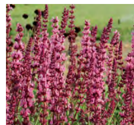
Salvia nemorosa 'Rosenwein' Sommer-Salbei

Blütenhöhe: 60 cm Blütezeit: Jun-Sep, R*