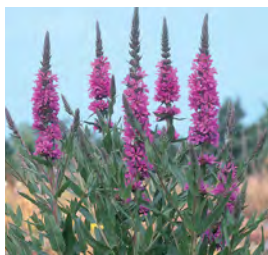
Lythrum salicaria Blutweiderich