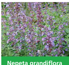
Nepeta grandiflora 'Bramdean' Großblumige Katzenminze