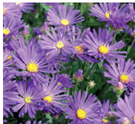
Aster amellus 'Veilchenkönigin' Berg-Aster