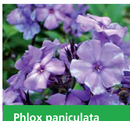
Phlox paniculata 'Blue Paradise' Große Garten-Flammenblume

Blütenhöhe: 80-100 cm Blütezeit: Jul-Sep