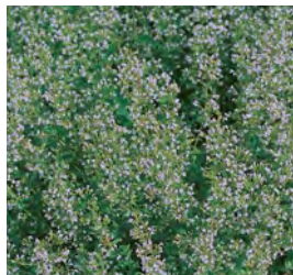
Calamintha nepeta ssp. nepeta Steinquendel

Blütenhöhe: 30-50 cm Blütezeit: Jul-Sep, R*