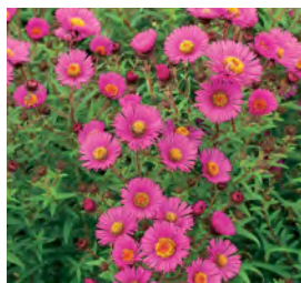
Aster novae-angliae 'Alma Pötschke' Rauhblatt-Aster