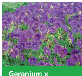
Geranium x magnificum 'Pracht-Storchschnabel'

Blütenhöhe: 70 cm Blütezeit: Jun-Aug, R*