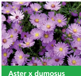
Aster x dumosus 'Herbstgruß vom Bresserhof' Kissen-Aster