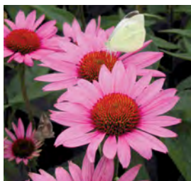
Echinacea purpurea 'Roter Sonnenhut'